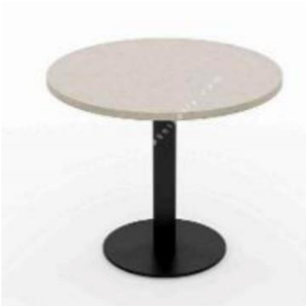
Tabla 18 mm E1 Kalite MDF Lam olacaktır. Tabla beyaz renkli olacaktır. Ayak Flanşı Ø400*6 mm DKP metalden imal edilmiş olup, yüzeyi fosfat yıkama sonrası 220° elektrostatik toz boya ile fırınlanacak. Sehpanın ayak kısmının rengi gri olacaktır. Boru Profil ölçüsü Ø60*2 mm DKP metalden imal edilmiş olup, yüzeyi fosfat yıkama sonrası 220° elektrostatik toz boya ile fırınlanacak. Genişlik ve Derinlik 0,50mm / Yükseklik 43cm